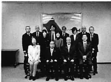
新潟県福祉団体 共同要望